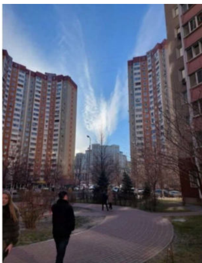
Ángeles sobre Kiev

Post scriptum: este texto fue escrito a mediados de febrero, la versión e 8 páginas en enero, es decir, antes del inicio de la guerra del régimen de Putin contra Ucrania el 24. 2. 2022. el término "crisis" en el texto aquí no se refiere a esta guerra.