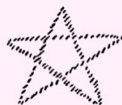
Dritter Logos Mikrokosmos