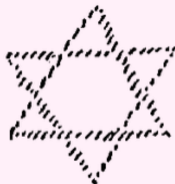
Deuxième Logos Le Macrocosme