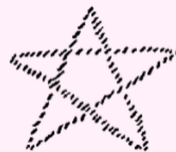
Troisième Logos Le Microcosme