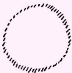
Первый Логос Бог

Если вы хотите узнать больше о более глубоком значении термина "логотип", посмотрите на https://anthrowiki.at/Logos . Вот откуда взялись изображения в этой рассылке.